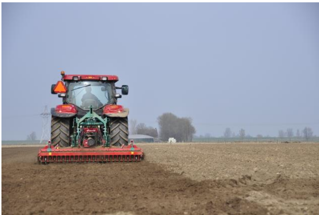
Foto 16; Duurzaam pachtbeleid leidt tot zorgvuldiger bodembeheer