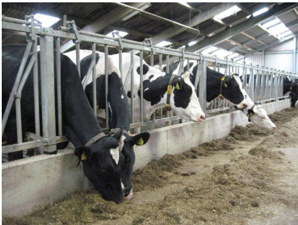
Foto 8; Melkveehouderij is de meest aanwezige dierlijke sector in Geertruidenberg