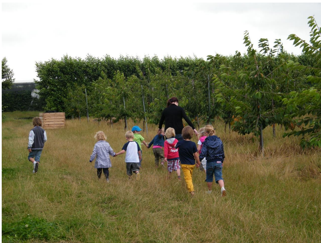
Foto 9; Raamsdonkse Klasseboeren laten kinderen kennismaken met de herkomst van voedsel

In de gemeente Geertruidenberg zien we momenteel als nevenactiviteiten op bedrijven vooral de afzet van lokale (streek)producten en recreatie. Ook kunnen onze agrariërs als 'Klasseboer' een impuls aan het basisonderwijs geven door kinderen letterlijk in de keuken van voedsel in hun eigen 'achtertuin' te laten kijken. Er liggen ook kansen en mogelijkheden voor andere vormen van multifunctionele bedrijfstakken, die zorgen voor verbinding tussen boeren en burgers. Denk daarbij aan maatschappelijke diensten zoals zorg, natuurbeheer, Co2-vastlegging of energieproductie.