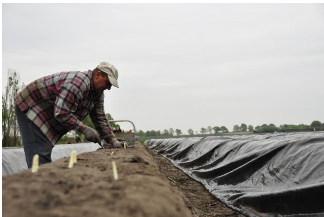
Foto 11; Voor de oogst van seizoensmatige teelten zoals asperge, zijn tijdens pieken extra arbeidskrachten nodig zoals scholieren, huisvrouw- en mannen of arbeidsmigranten

Het invullen van voldoende en geschikte tijdelijke arbeidskrachten blijft wel een uitdaging voor onze bedrijven. Tijdelijke arbeidspieken als gevolg van seizoensmatige teelten worden binnen de gemeente Geertruidenberg veelal ingevuld door lokale arbeidskrachten zoals scholieren, huisvrouwen- en mannen, en deels door arbeidsmigranten. Er is daarnaast een tekort aan hooggeschoold personeel op het vlak van management, teelt en techniek. De sector investeert veel in werving, promotie en robotisering om minder afhankelijk te zijn van personeel en om kosten te besparen. Echter, de ontwikkeling van deze technieken vraagt veel tijd en financiële middelen, en de werving levert nog niet overal het gewenste resultaat.