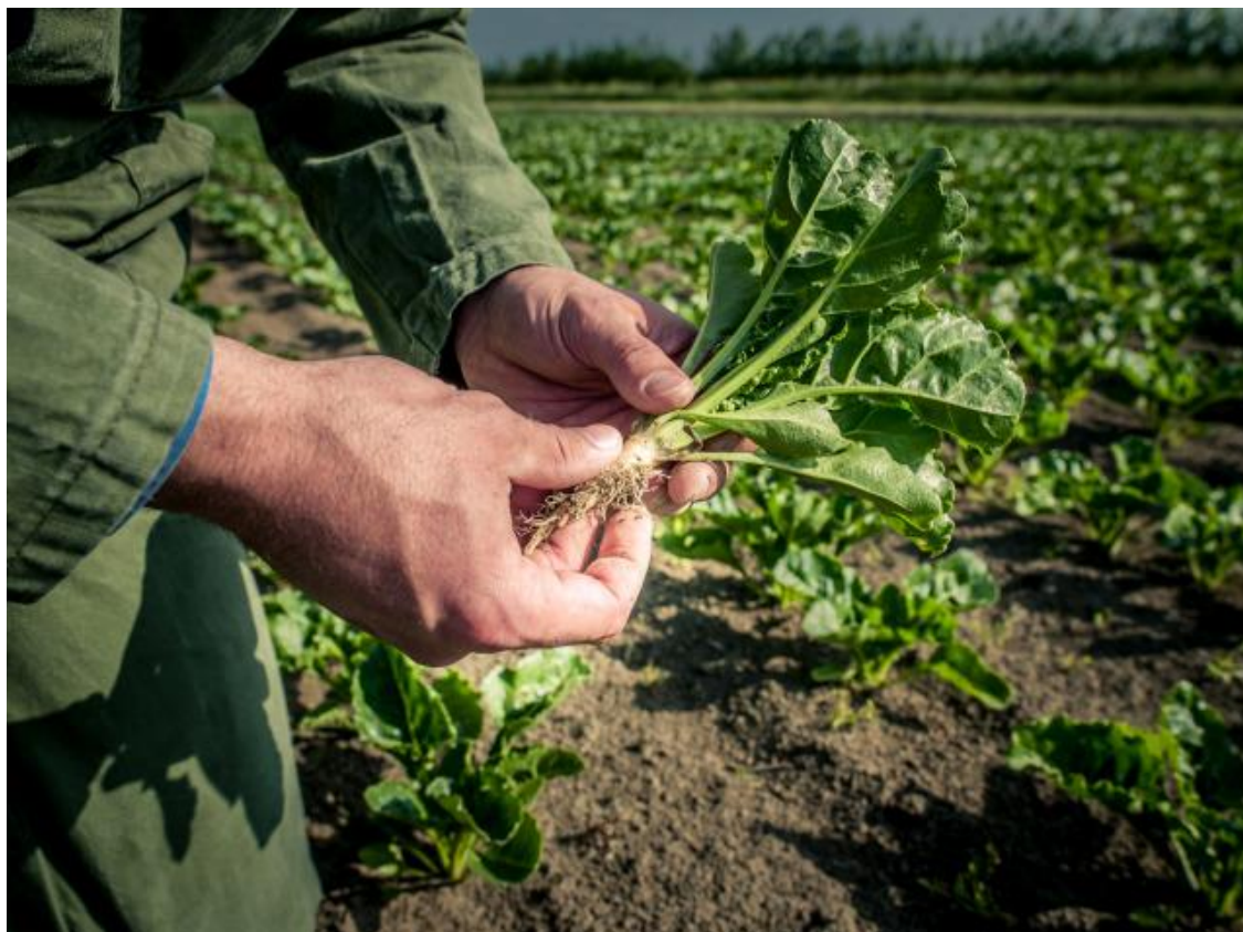
Foto 14; Land- en tuinbouw in Geertruidenberg vormen de groene long van de gemeente

Sommige bewoners in onze gemeente maken zich zorgen over fijnstof in de lucht, en voelen zich 'platgedrukt tussen de Amercentrale en knooppunt Hooipolder'. Landschappelijke inpassing bij de herinrichting van knooppunt Hooipolder en de verbreding van de A27 kan zelfs in combinatie met de inrichting van een waterretentiegebied worden gezien als slimme koppelkans voor meer groen in de gemeente Geertruidenberg en als ecologische verbinding dienen.