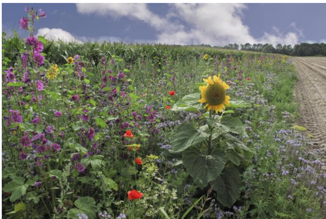
Foto 13; Agrariërs zijn in staat om groen en natuur te ontwikkelen en beheren

Maatschappelijke diensten in het buitengebied genereren daarnaast welzijn voor de bewoners en bezoekers. Ze maken het buitengebied aantrekkelijker voor toerisme en recreatie, en zorgen voor meer economische activiteit. Echter komt nu slechts een klein deel van deze inkomsten terecht bij de bewoners van het buitengebied. Wij willen graag met de gemeente op zoek naar mogelijkheden om de ondernemers in het gebied economisch meer te laten delen in de bijdrage die het buitengebied heeft op en in de regio.