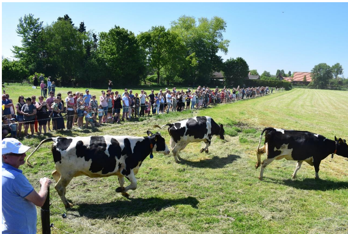
Foto 10; Het Boer & Festival in Raamsdonk biedt nieuwe verbindingen tussen boer en burger