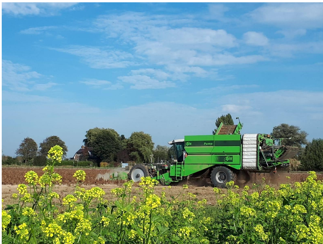
Foto 4; Akkerbouw is de grootste plantaardige sector in Geertruidenberg – bron Landbouwbedrijf Oomen

Daarmee wordt niet alleen een belangrijke bijdrage geleverd aan de Brabantse economie, maar ook aan de productie van duurzame energie en het behoud van een vitaal en divers platteland. Met een stijgende vraag naar plantaardige producten, stijgt ook de waardering van consumenten voor lokaal geproduceerde kwaliteitsproducten. Onze akkerbouwers en tuinders in Geertruidenberg zorgen iedere dag voor de hoogst mogelijke kwaliteit aardappelen, tarwe, suikerbieten, groenten en (zacht)fruit van de vruchtbaarste gronden en uit de modernste kassen. Maar ook plantgoed, pootgoed en siergewassen vinden hun weg vanuit deze gemeente.