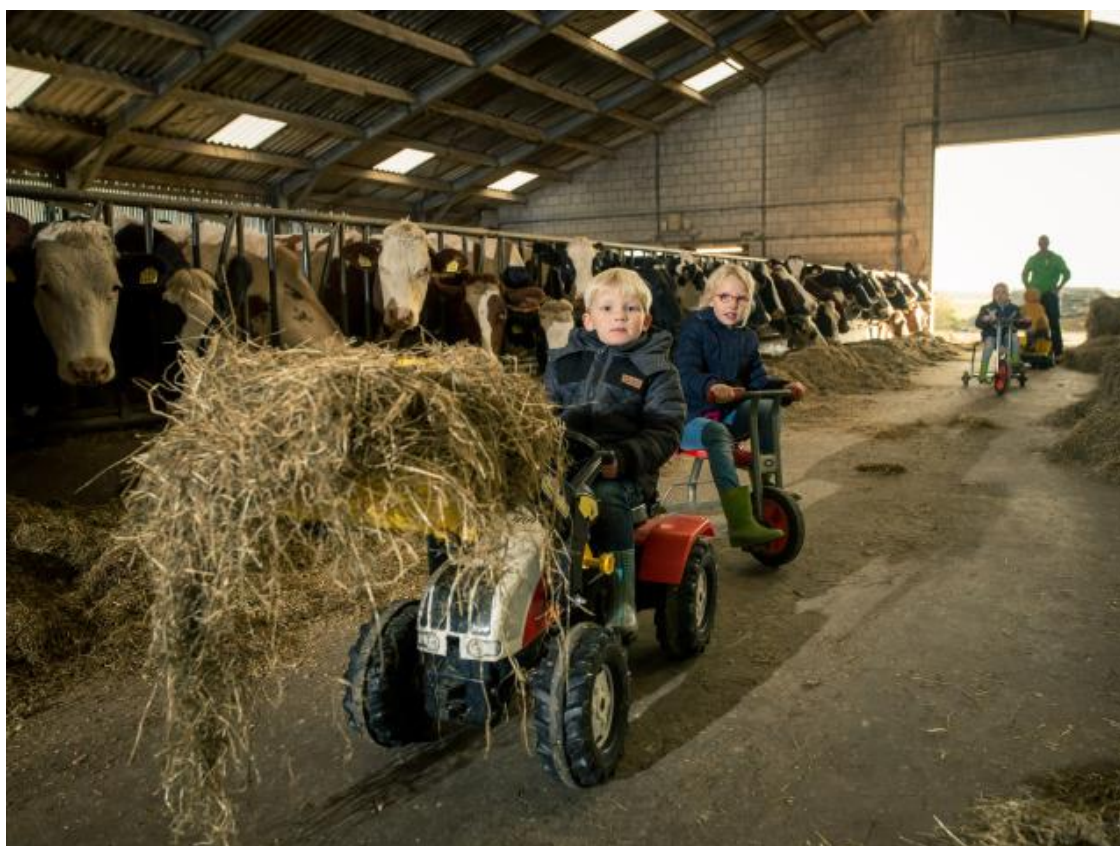
Foto 3; Voldoende ontwikkelingsruimte voor onze ondernemers in de nabije en verre toekomst

In Geertruidenberg hebben we een vitaal buitengebied met een duidelijk economisch en sociaal belang voor de hele gemeente. Voor behoud van deze vitaliteit is ruimte om te ondernemen nodig, met name voor de (jonge) ondernemers die hun (familie)landbouwbedrijf voort willen zetten. Maar ook mogen ontwikkelingen op locaties die zullen gaan vervallen als agrarisch, doordat bedrijven stoppen, worden gesloopt of verkocht aan burgers, niet te koste gaan van de land- en tuinbouwstructuur. We willen er samen naar streven dat de agrarische sector in Geertruidenberg voldoende ontwikkelingsruimte blijft houden, om zich te kunnen blijven vormen naar de kansen, bedreigingen en uitdagingen van de nabije en verre toekomst.