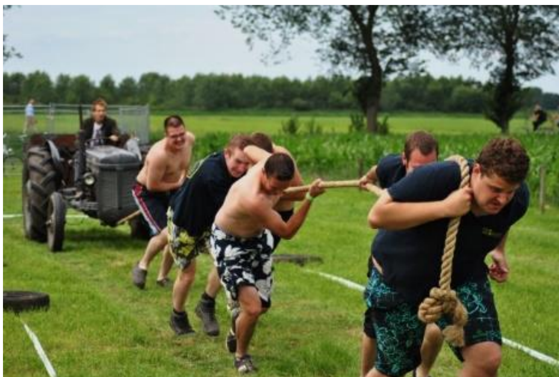
Foto 2; De agrarische sector levert graag een bijdrage aan de Raamsdonkse Dollemansdagen

Daarnaast speelt op sociaal gebied de agrarische sector in de gemeente Geertruidenberg nog steeds een belangrijke rol in de lokale samenleving. Denk aan het beschikbaar stellen van de vele ruimtes en materialen voor de bouw van carnavalswagens, of grond voor de organisatie van de Dollemansdagen of bijvoorbeeld de Victoriarun. En het mede faciliteren van de Halloweentocht of activiteiten van Xieoe. Allemaal activiteiten waar de agrarische sector graag een lokale bijdrage aan levert. Een groot goed in deze huidige tijd van individualisme, wat we gezamenlijk willen blijven koesteren.