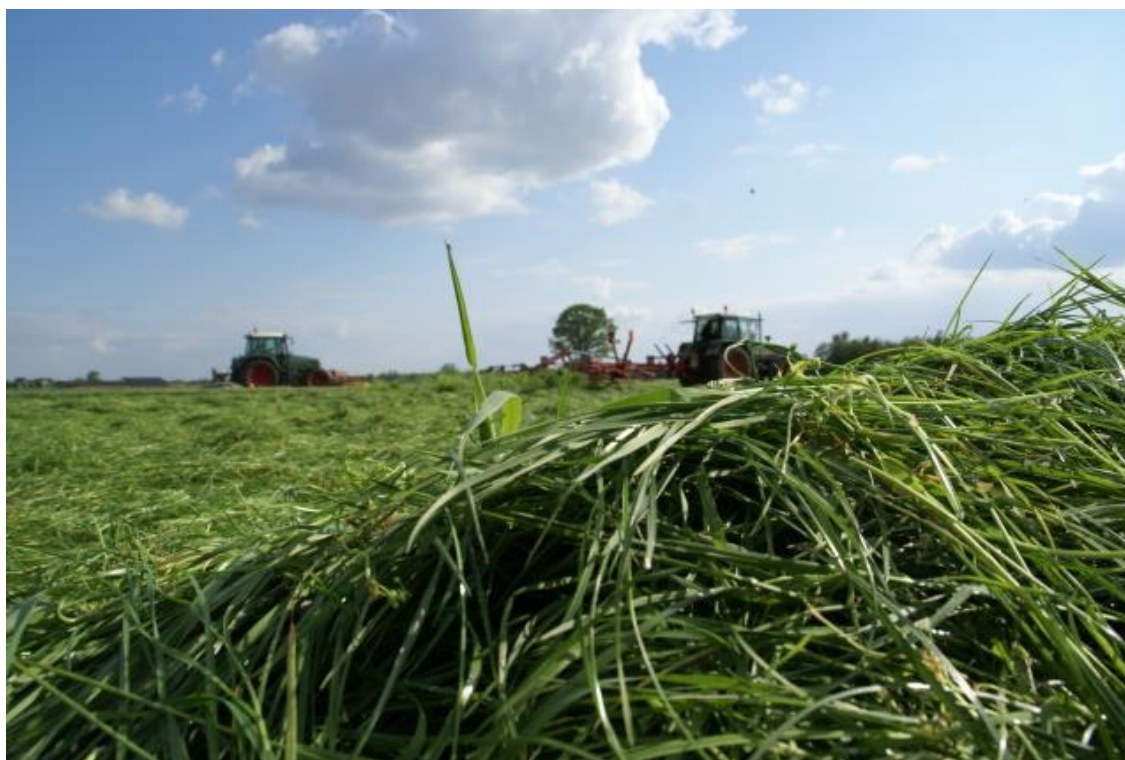
Foto 6; Agrariërs blijven ook in Geertruidenberg afhankelijk van voldoende landbouwgrond

Opvallend is dat op deze bedrijven in de gemeente Geertruidenberg veel jonge ondernemers actief zijn. De bedrijven die grondgebonden werken, willen dit ook blijven doen. Naast de aanpassingen die nodig zijn vanuit de provinciale en landelijke regels zullen zij mogelijk meer gaan inspelen op kringlooplandbouw, toepassen van weidegang en/of natuurinclusief boeren. Hier moeten de boeren wel de ontwikkelingsruimte voor hebben in beleid, maar ook in voldoende, betaalbare (pacht)grond. Ook voor extensivering van bedrijven zijn juist grotere stallen, uitloopruimten en bouwblokken nodig, zodat meer ruimte voor de dieren beschikbaar is.