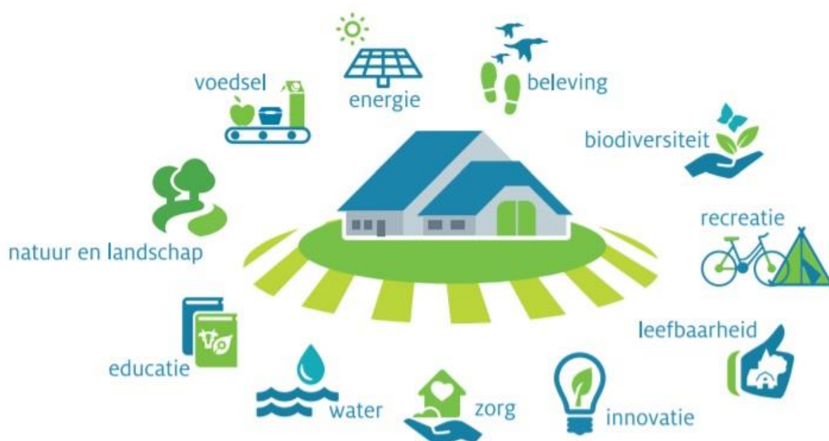
Afbeelding 2; De diensten die de agrarische sector kan leveren aan de (lokale) maatschappij

Daarnaast onderhouden we als agrariërs gezamenlijk het Nederlandse landschap. Niet alleen vanuit individueel ondernemersbelang, maar ook ten behoeve van de omgeving en maatschappij. Een florerende agrarische sector, vertaalt zich in een groen en afwisselend buitengebied waar het goed vertoeven is. Er wordt echter meer dan ooit een beroep gedaan op boeren en tuinders. De wetgeving en regulering is toegenomen, evenals de vraag naar gezond voedsel, schoon water, CO2-neutrale productie en de kritische maatschappelijke houding ten opzichte van herkomst en productie.