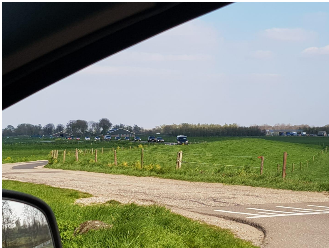
Foto 18; Sluipverkeer is een bron van zorg in het buitengebied van Geertruidenberg

Vanuit ZLTO Drimmelen-Geertruidenberg zijn verkeersveiligheid en bereikbaarheid van agrarische bedrijven en percelen van groot belang. Zeker omdat in Geertruidenberg de hoeveelheid verkeer, als gevolg van de aanpak van knooppunt Hooipolder en de A27, de komende jaren fors zal toenemen. Sluipverkeer willen we zoveel mogelijk weren uit de polders, om de verkeersveiligheid te vergroten. Daarbij blijft het onderhoud van doorgaande en tussenwegen een aandachtspunt, zodat ook landbouwmachines veilig over de openbare weg kunnen blijven rijden.