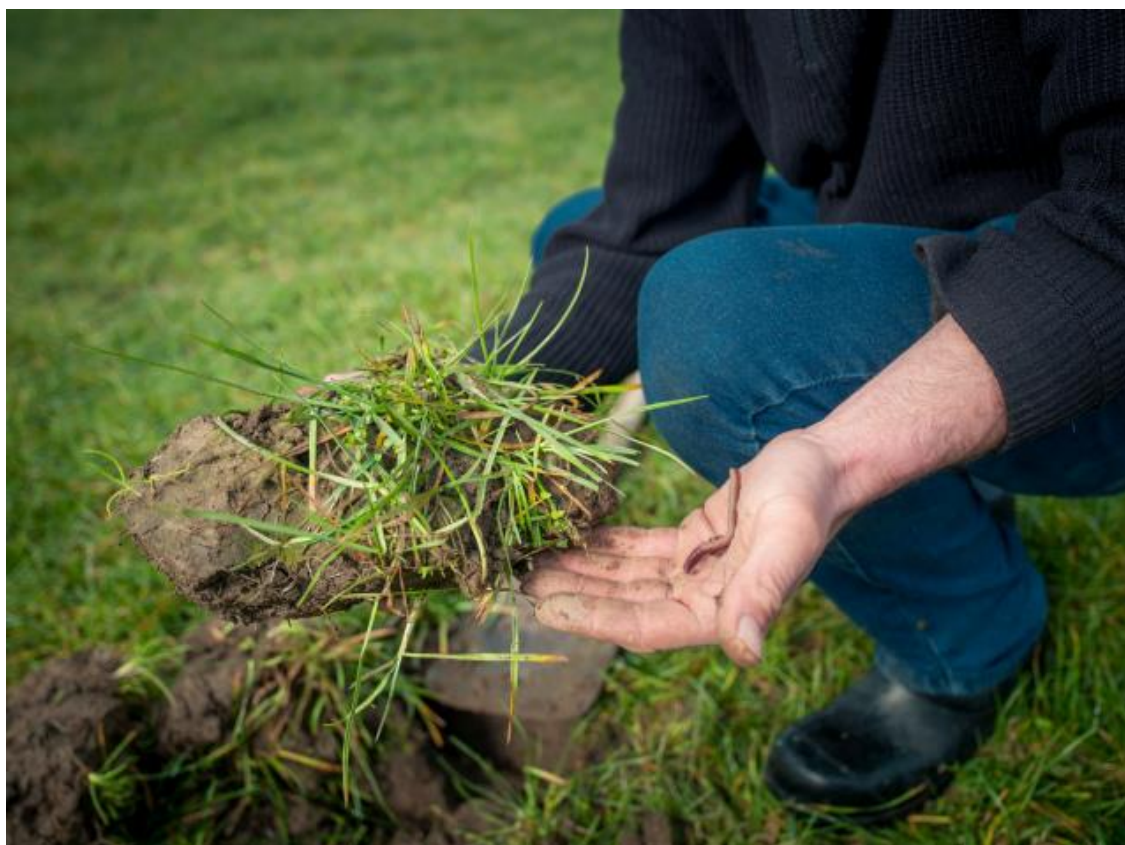
Foto 15; Een gezonde bodem is van belang voor gezonde en weerbare gewassen

De gemeente Geertruidenberg heeft landbouwgrond in eigendom. De laatste jaren lijkt landelijk de trend voor dergelijke gronden om ze te verpachten aan de hoogstbiedende om zo bij te kunnen dragen aan de gemeentelijke begroting. Een hoge pachtprijs heeft echter als nadeel dat de grondgebruiker het maximale van de grond wil halen met zo min mogelijk input. Dat kan leiden tot verkeerde grondbewerking, verdichting van de ondergrond, achteruitgang van organische stofgehalte en gezond bodemleven, en het nalaten van onderhoudsbemesting. Wanneer dit jaren achtereen doorgaat, ontstaat rooibouw op deze gronden. Een duurzaam bodembeheer heeft daarentegen voordelen voor de omgeving, zoals optimale waterberging en Co 2 -binding door een hoger organische stofgehalte. Wanneer de grondgebruiker de zekerheid heeft dat hij de grond gedurende een langere periode in gebruik kan hebben (in plaats van slechts één jaar), verhoogt dat de bereidheid van de agrariër voor zorgvuldiger bodembeheer. We gaan graag in gesprek met de gemeente om tot een duurzamer pachtbeleid te komen.