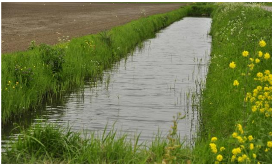
Foto 12; Goed onderhouden watergangen zorgen voor het beperken van verdroging in het buitengebied en bieden voldoende capaciteit bij het verwerken van extreme neerslag

Het beste voorbeeld is de mogelijkheid voor het vasthouden van water in watergangen. Weliswaar is het waterschap de beheerder van het grond- en oppervlaktewater, maar minder dan 10% is daadwerkelijk in onderhoud bij het waterschap. Vooral de kleinere watergangen (de zogenoemde B- en C-watergangen) en greppels zijn in onderhoud bij de naastliggende grondgebruiker. Vaak is dat de gemeente, bijvoorbeeld als wegbeheerder of als beheerder van sportvelden en openbaar groen. Juist deze kleinere watergangen lenen zich uitstekend om regenwater vast te houden in het gebied, zodat het kan worden toegevoegd aan het grondwater en verdroging beperkt. Dat kan via maatregelen als de aanleg van stuwtjes, schotten, verhoogde duikers etc. Vaak geeft het waterschap hiervoor een financiële ondersteuning. De keuze van de maatregelen komt het meest tot zijn recht als die qua soort en locatie wordt afgestemd met de naastliggende agrariërs.