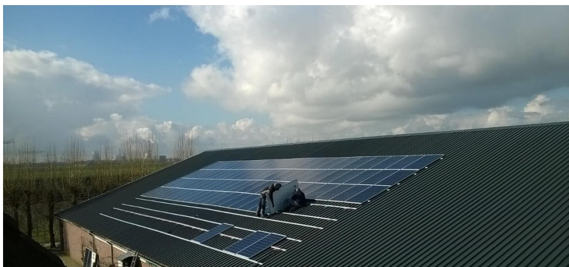
Foto 17; In Geertruidenberg zijn al veel agrarische daken voorzien van zonnepanelen

De ontwikkeling van zonnedaken is, ook financieel, het meest voor de hand liggend voor agrariërs. Een goed geïsoleerd integraal (zonne)dak, is in de sector steeds meer gemeengoed. Er zijn nog wel obstakels voor de aanleg van nieuwe daken, zoals het op korte termijn vervallen van de salderingsregeling, aanpassing van de postcoderegeling en de SDE++ regeling die lagere vergoedingen gaat uitkeren. Deze ontwikkelingen werken schaalvergroting, zoals grotere dakoppervlakten en/of zonnevelden, in de hand. Andere bepalende factor is de netwerkbeschikbaarheid en de steeds hoger wordende aansluitkosten. Verwijdering van asbest kan juist versneld worden door toepassing van zonnedaken, maar is door de hoge kosten nog vaak een drempel. Een gemiddeld zonnedak van 1000 m 2 levert ongeveer een stroomhoeveelheid op die gelijk is aan het verbruik van 45 huishoudens.