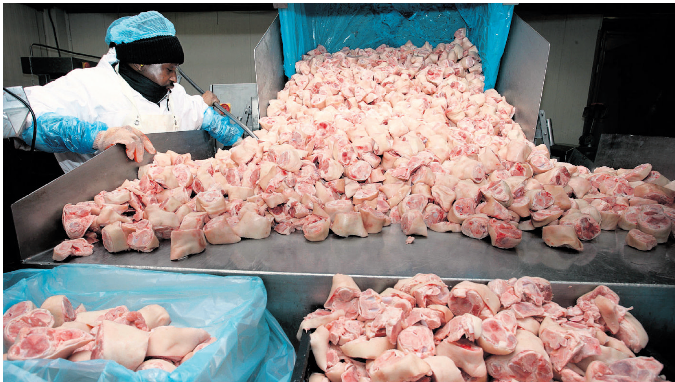
Vleesverwerkende industrie in Oss. Volgens Planbureaudirecteur Hajer moet het in Nederland „hip worden gedifferentieerd met vlees om te gaan”.

Maar ook de intensieve landbouw moet de biodiversiteit niet verwaarlozen, meent de Planbureau-directeur. „Ook op het platteland hoort natuur thuis.” Om natuur en landschap in de hoger gelegen delen van Nederland verder te versterken én de landbouw mogelijk te maken, zou je