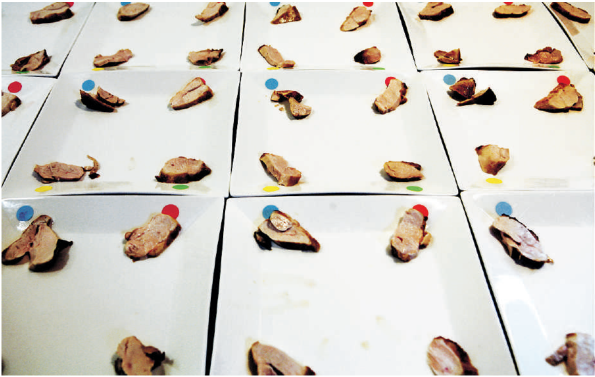
Vier soorten kip voor vijftig fijnproevers.