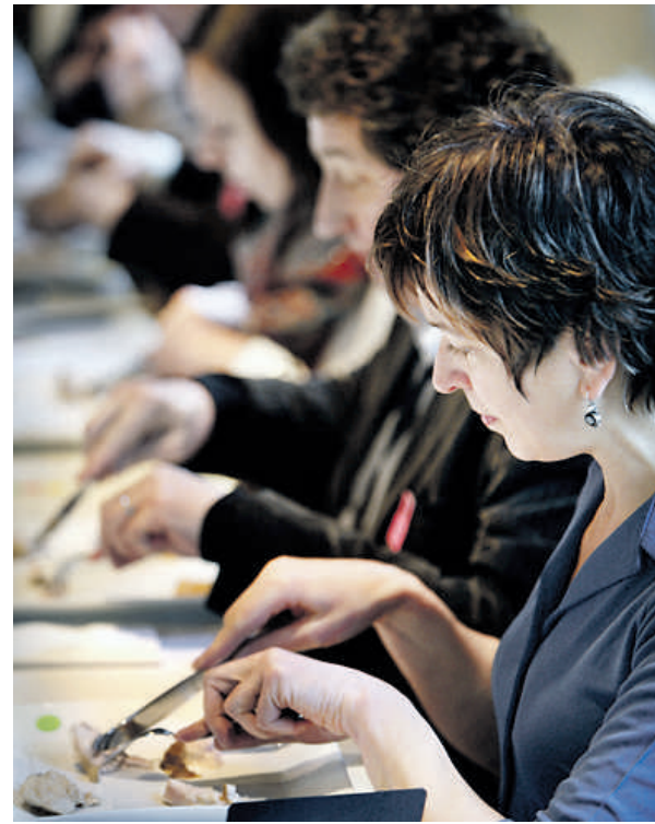
Hoe ouder de kip, hoe steviger de bite.