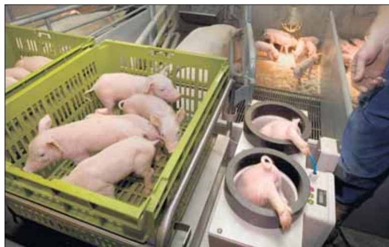
Verdoving van biggen. Wakker Dier won een prijs met een actie tegen onverdoofde castratie. "In plaats van een prijs, verdiende ze straf".

Boeren moeten 'ns beginnen gewoon zelf te laten zien hoe het zit en hoe het nog veel beter kan. In de media. Open dagen hebben geen zin. Schelden op Wakkere Dieren, Antoinette Hertsenberg of Marianne Thieme al evenmin. Je moet ze voor zijn.