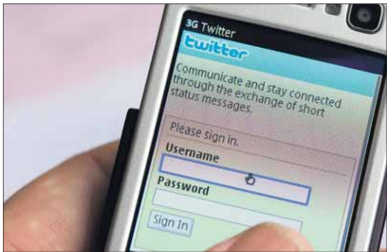
Maxime Verhagen is de succesvolste Twitteraar onder politici.