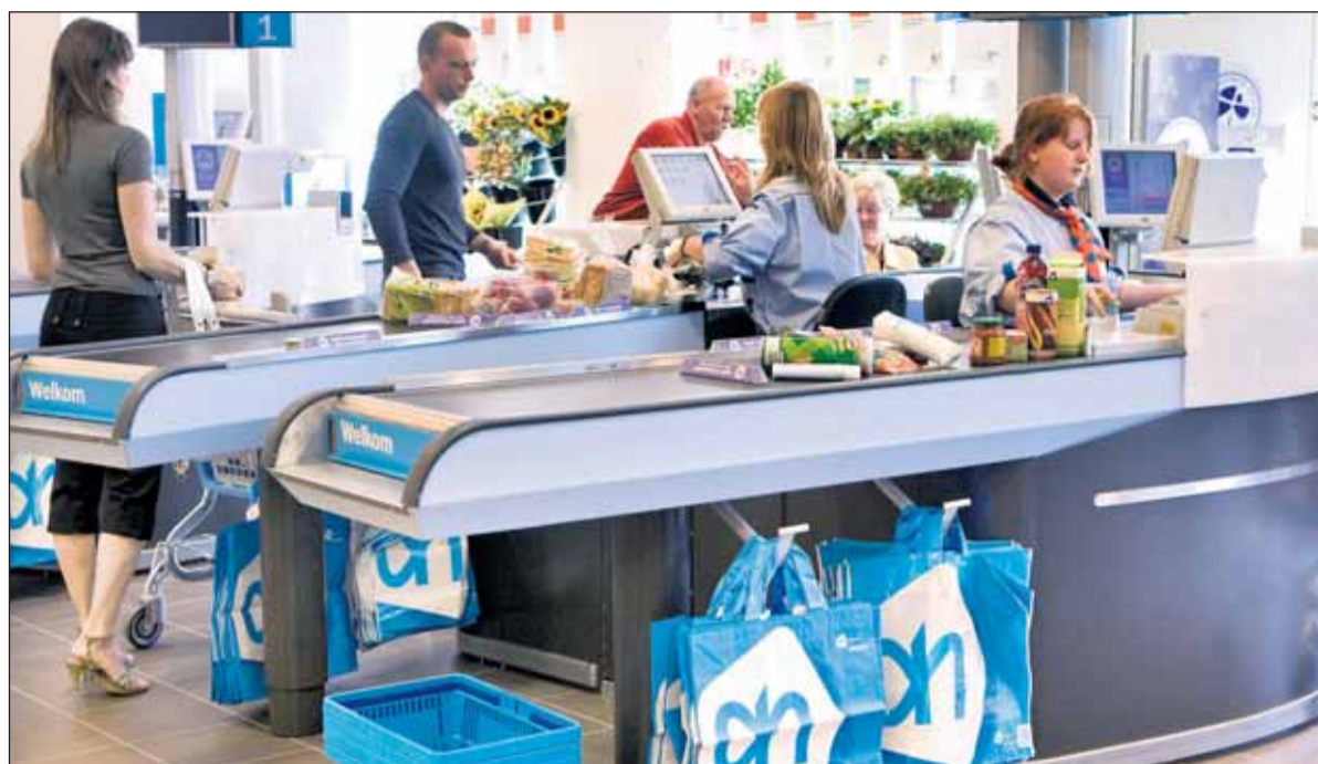
Albert Heijn is niet van plan op korte termijn zelf een kwaliteitslogo te ontwikkelen.